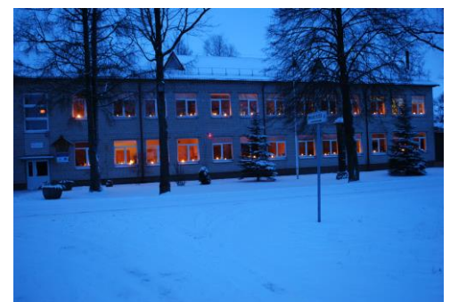
Raseinių r. Paupio mokykla- daugiafunkcis centras