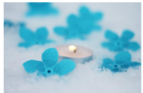
Kelmės J. Graičiūno gimnazija