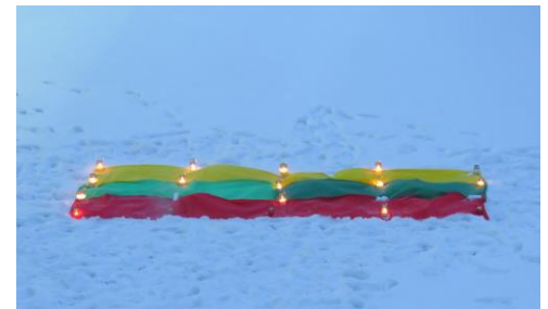
Kaišiadorių Vaclovo Giržado progimnazija