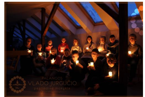
Palangos Vlado Jurgučio pagrindinė mokykla