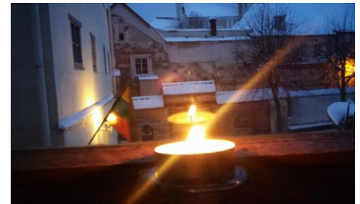
Lietuvos technikos biblioteka