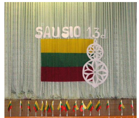
Klaipėdos „Medeinės“ mokykla